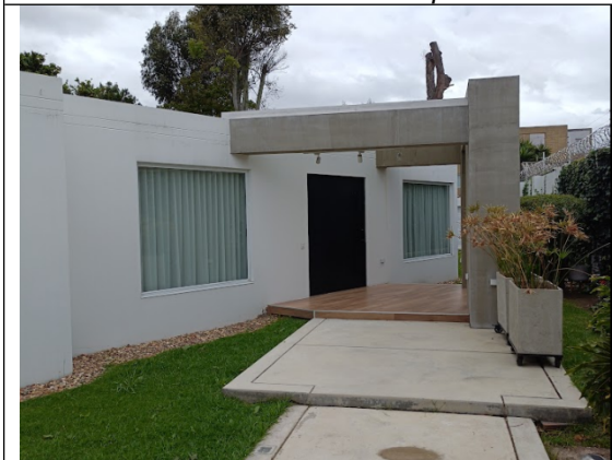
Foto No. 3. Vivienda No.1