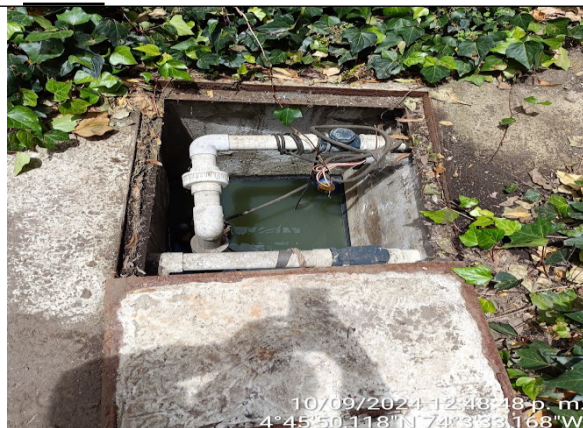
Foto No. 8. Salida ARD a canal a tierra Cra 68