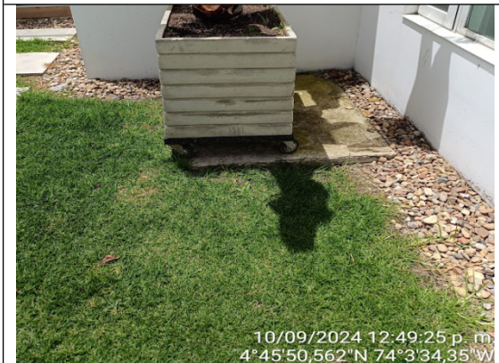
Foto No. 5. Ubicación Trampa de grasas Casa 2.