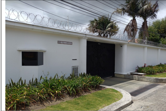
Foto No. 1. Fachada del predio.