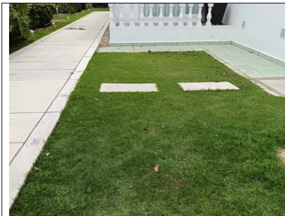
Foto No. 7. Cajas de paso y antiguo sitio para vertimiento a suelo.