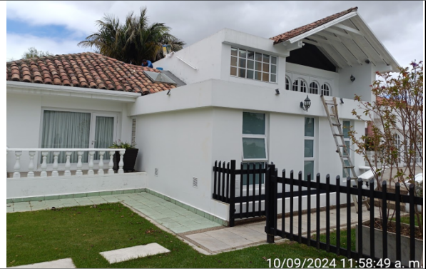
Foto No. 2. Vivienda No.1