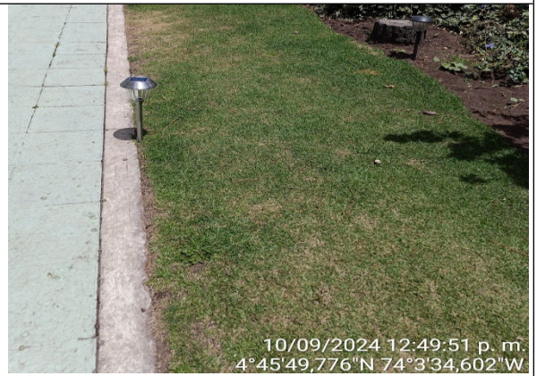
Foto No.4. Ubicación Trampa de grasas Casa 1