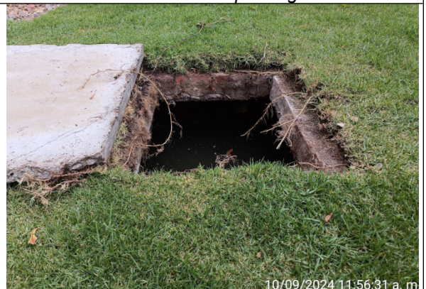
Foto No. 6. Pozo séptico